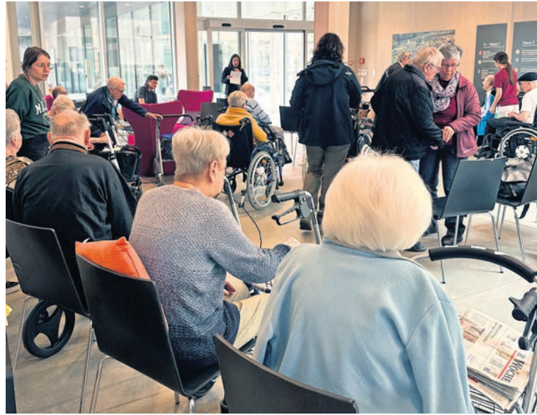
Zahlreiche Gäste an der Osterfeier im Pflegezentrum.

die das Fest für viele zu einem emotionalen und freudigen Erlebnis machten.