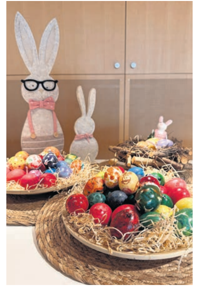
Bereit zum Eiertütchen.

Das gemeinsame Gestalten der Ostereier weckte bei vielen Bewohnerinnen und Bewohnern sowie Tagesheimgästen schöne Ostererinnerungen und förderte gleichzeitig das kreative Arbeiten, die Feinmotorik, die Konzentration sowie die Freude am Malen. Die Aktivität bot eine willkommene Abwechslung im Pflegealltag und stärkte das Gemeinschaftsgefühl.